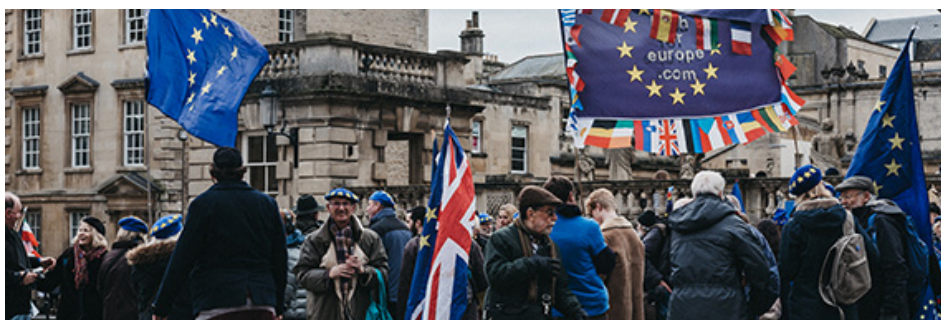
Nach der Ablehnung des Brexit-Deals durch das britische Parlament ist das künftige Verhältnis zwischen Großbritannien und der EU ungewiss. Die Stimmen für ein zweites Referendum mehren sich.

Am Dienstag hat das britische Unterhaus den Ausstiegsvertrag zwischen der Europäischen Union und Großbritannien abgelehnt. Das Land steht vor dem politischen Chaos, es droht ein Brexit ohne Vertrag und damit potentiell unanschätzbare Folgen für die Wirtschaft auf beiden Seiten.