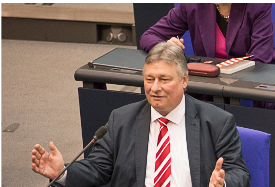
Zeit, um Klartext zu Reden: Der Verkehrspolitiker Martin Burkert sprach im Plenum des Deutschen Bundestages zur Bahnpolitik.

Die Probleme bei der Bahn liegen auf der Hand: Qualität und Pünktlichkeit sind im Keller. Es fehlt an Zügen und Personal. Demgegenüber stehen rund