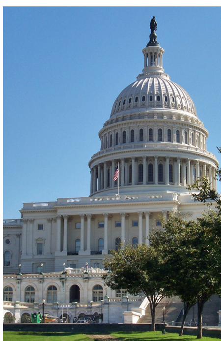
Das Capitol in Washington.

Für die globale Abrüstung hat es in der letzten Zeit düster ausgesehen. Der INF-Vertrag über nukleare Mittelstreckensysteme war 2019 durch die USA und Russland gekündigt worden. Der letzte verbliebene große Abrüstungsvertrag – New START – wird zum Glück jetzt verlängert. Er wäre sonst im Februar ausgelaufen. Putin und Biden haben sich auf die Verlängerung des